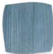
Frassino azzurro Light blue Ash