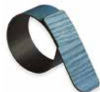
Frassino azzurro Light blue Ash