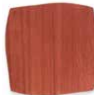
Toulipier rosso mattone Brick red Toulipier