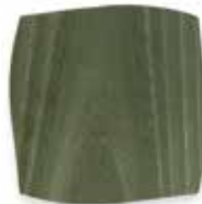
Frassino verde scuro Dark green Ash