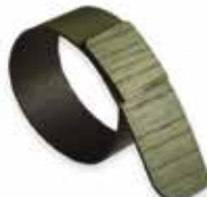
Frassino verde scuro Dark green Ash