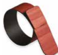
Toulipier rosso mattone Brick red Toulipier